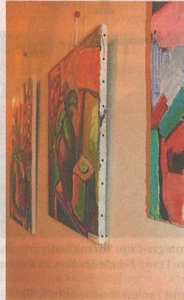
Kunstwerke: Es wurden Kunstwerke unterschiedlicher Machart gezeigt. Reischenbacher